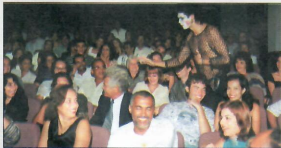
O Grupo Los Catedrásticos apresentou um irresistível show de humor para uma platéia lotada.