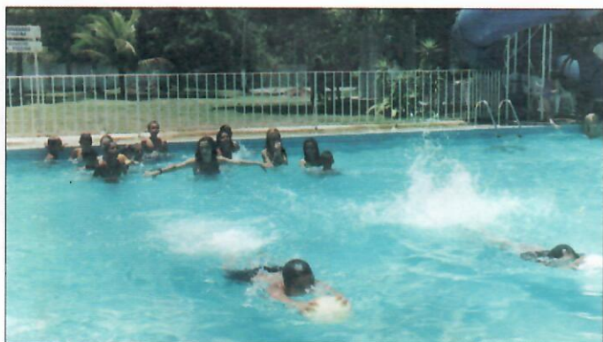
Um novo gradil garante mais segurança para as crianças na piscina

administração, secretaria, cultural e social, cada qual com um rol de metas a cumprir. "Fizemos muitas melhorias na sede do Sítio São Paulo. Inicialmente, adquirimos um equipamento de som para sessões de karaôkê. Logo em seguida, construímos