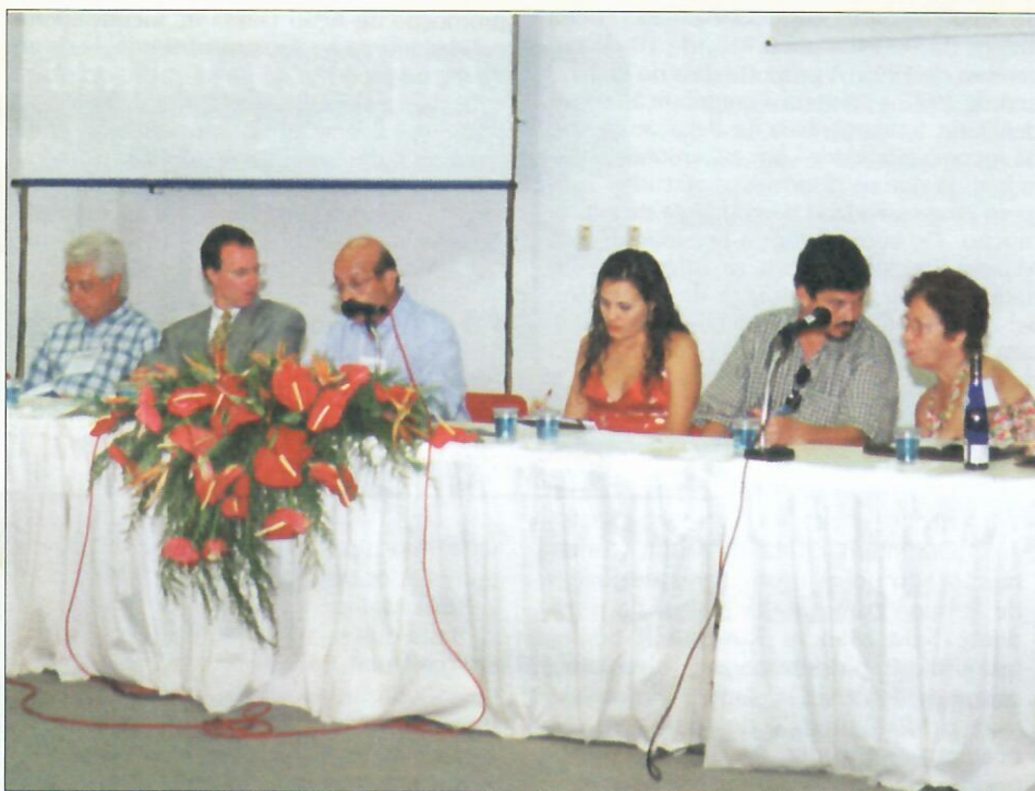
O IV Congresso Estadual do Ministério Público foi um sucesso

A Folha do MP traz um balanço do que foi feito, ao longo dos dois anos de gestão da atual Diretoria da Associação do Ministério Público do Estado da Bahia. Essa proposta, articulada por todos os que estiveram à frente do projeto intitulado "Humanização e Trabalho", traduz o ímpeto de demonstrar o nível de comprometimento que cada um dos realizadores reafirmou nos diversos momentos de obtenção de conquistas, de concretização de metas. Ou seja, nos momentos em que ficava claro o quanto tais metas foram traçadas em prol do interesse maior dos promotores e procuradores de justiça baianos.